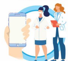
В СЛУЧАЕ ЗАБОЛЕВАНИЯ ОБРАЩАЙТЕСЬ К ВРАЧУ